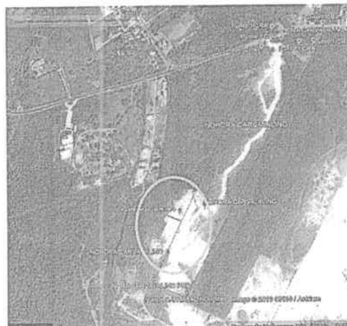
Figura N° 1. Ubicación: Delante la entrada a Salgar por la antigua vía que conduce de Barranquilla al municipio de Puerto de Colombia.