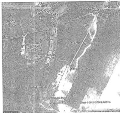
Figura N° 3.

N11°0'30.66" – W074°55'50.61" N11°0'29.76" – W074°55'51.17" N11°0'26.69" – W074°55'53.14"